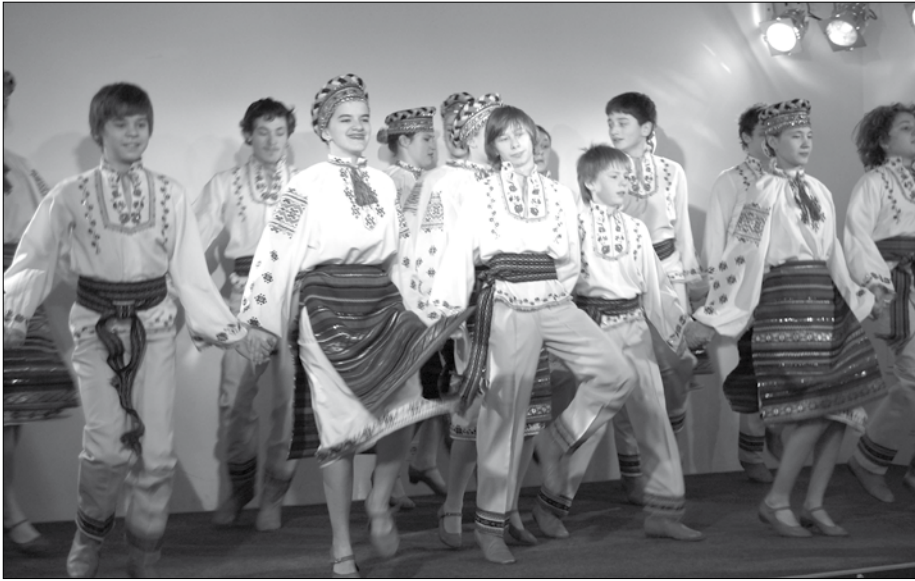
Das Kindergesangs- und Tanzensemble „Polunischka“ und „Sonetschko“ aus Lviv in der Westukraine war zu Gast in der ORANGERIE und begeisterte die Zuschauer/ Foto: G. Ulbricht

Сегодня у нас в гостях выступали музыкально- танцевальные группы „Полуничка“ и „Сонечко“ из города Львова. Молодёжные ансамбли были замечательно подготовлены, ими исполнялись танцы, характерные для всех уголков Украины, лирические